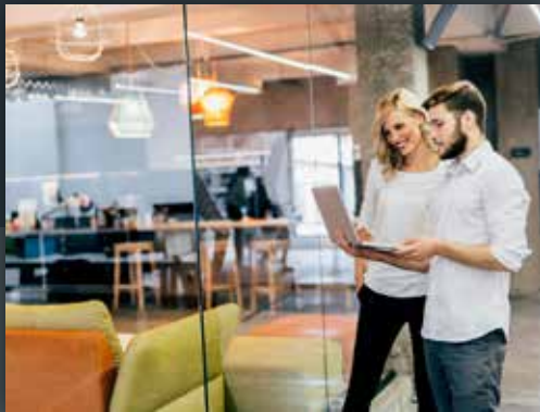
Organisatie & Groei